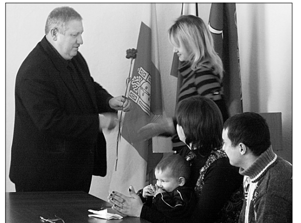
16 молодых семей получили свидетельства на получение социальной выплаты для приобретения (строительства) жилья по программе «Обеспечение жильем молодых семей Андреапольского района», реализуемой с 2006 года.