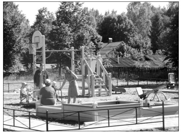
В городе появились спортивная и две детские площадки. Одна из них — подарок губернатора Тверской области Дмитрия ЗЕЛЕНИНА.