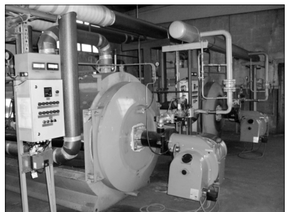
12 февраля введен в эксплуатацию газопровод среднего давления (18,109 км). В начале марта природный газ появился в 800 квартирах жителей Андреапольского района.